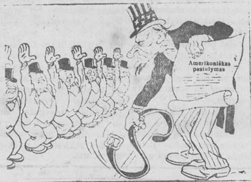
— Na, dar kartā: kas „uz“?