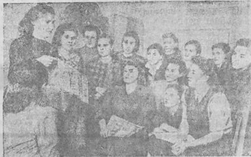
MASKVA. Vyksta* pasiruošimas rinkimams į vietines DŽD Tarybas. Sostinės pramonės įmonėse bei įstaigose agitatoriai supažindina darbininkus ir tarnautojus su Rinkiminiais nuostatais.

Reikia tikėtis, kad minėtų sienlaikraščių redakcijos ir įstaigų vadovai viena kartą teisingai įvertins sieninės spaudos reikšmę ir imsis konkrečių priemonių sienlaikraštyje talpinamos medžiagos politiniu bei idėjiniu pakėlimu, jos aktualumu, nevenss bolševikinės kritikos ir savikritikos, sutelks apie save didesnį skaitytojų korespondentų.