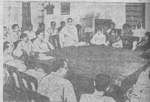
PAKIŠTANAS. Lachoros mieste plačiai išsivystė parakinimas po Pasaulinio taikos šalininkų kongreso Nuolatinio komiteto Stokholmo atsišaukimo.

PARYŽIUS, IX. 24 d. (TASS). Paryžiaus radijo pranešimu, per vakarykštį amerikiečių aviacijos per klaidą įvykdytą anglų brigados dalių subombardavimą, angliai neteko 150 žmonių. (ELTA).