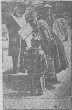
JUNGTINĖS AMERIKOS VALSTYBĖS. Šalyje vis plačiau vystosi parašų rinkimo kampanija po Pasaulinio taikos šalininkų kongreso Nuolatinio komiteto Stokholmo atšaukimu.

Kituose frontuose ypatingų paktimų neįvyko. (ELTA).