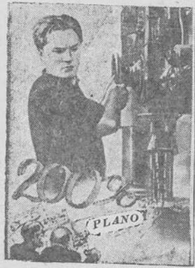
ATSAKYMAS KARO KURSTYTOJAMS

Prieš mėnesį laiko, paremdami Tarybinio taktai ginti komiteto atsišaukimą — už tvirtą taiką visame pasaulyje, valstybinio žemės ūkio mašinų fabriko „Plūgas“ dirbančiųjų kolektyvas stojo į stachanovinę taikos sargybą ir pasiekė rimtų gamybos laimėjimų. Dirbdami su šūktu: „Savo geru darbu stiprinsime taikos reikalą“, plūgėčiai žymiai viršija mėnesines išdirblio normas, įneša savo indėlį į Tarybų šalies — patikimiausios višame pasaulyje taikos tvirtovės — galios augimą.