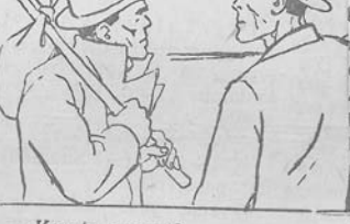
— Kur tu gyvenai? — O štai, matai tuos namus? Už jų gyvenu.

name, kuriam taip pat reikės nedidelis remontas. kyklos direktoriaus drg. ekaus ir Žiobiškio apylinvykdomojo komiteto butlir neatidėliotinos svarbos las — užtikrinti mokyklos simą iki naujųjų mokslo kad, jiems prasidėjus, leivisi turėtų jauklas ir hikas mokymosi sąlygas. M. Aleinikovas