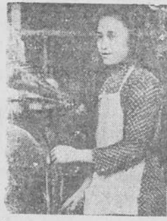
Kinijos liaudies respublikos valstybinė imonė sėkmingai išpildė pramonės gamybos programą. Daugelyje fabriku bei imonų darbo lentynių pirmąją normą pastatujamo darbo pavysdžius.

LONDONAS, VIII. 1 d. (TASS). Reuterio agentūros Tokio korespondento pranešimu, Makarturo štabas paskelbė, kad pirmosios amerikiečių jūrų pėstininkų dalys šiandien po vidurdienio atplaukė į Pietų Korėjos uostą. (ELTA).