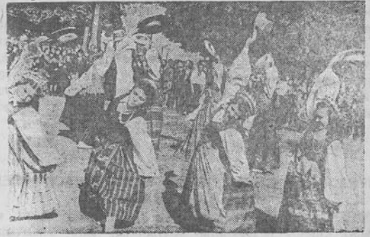
Nuotraukoje: Jurbarko vidurinės mokyklos mokinių tautinių šokių ratelis — respublikinės Dainų šventės dalyvis.

M. BEREZINAITĖ, Rokiškio apylinkės „Tiesos“ kolūkio valstietė