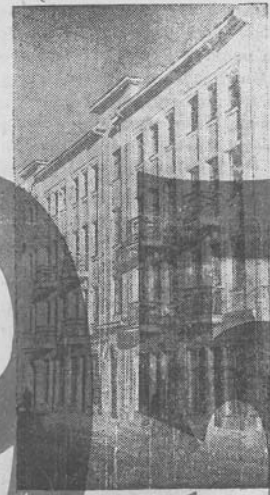
Spartai atstatyta hitlerininkų sugriauti Šaulių. Po karo mokytojų TSE vartinei atstatyti ir sutvarkyti daugiau kaip 1200 namų, tamsu tarpu liūtos gatvės. Nuotraukoje: naujai pastatyti namai „Elnio“ kombinato stachanoviniams.