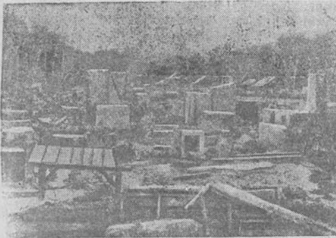
Nuskaistamą kolonialinį karą veda anglai prieš malajiečių liaudį, kovojančią už savo laisvę. Žiauriai sustvarko anglišką „civilizaciją“ su tūkiais gyventojais, neįgaliečiais nei seneliais, nei vaikais. Anglų kartaomenės užimtį kaimai deginami.

Nuotraukoje: angli kartaomenės sudėginti malajiečių kaimo griuvėsiai.