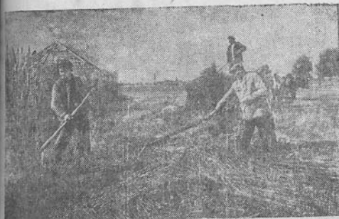
UKRAINOS TSR. Vinticos srities kolūkiu „Derliaus diena“ kolūkiečiai viršijo gyvulininkystės išvystymo planą. Kolūkyje plačiai pritaikomas žalienuis konvejeris, kuris žymiai padidina visuoamėnės gyvulininkystės produktivumą. Nuotraukje: pašaro paruošimo brigados kolūkiečiai žaliau pašarui plauna žalienuis rugius.

„Audros“ kolūkio (Ragelių vis.) valstiečiai savaitės begyje pataisė daugiau kaip 1,5 km kelio, gerai įj nužvyravę ir pagilinę griovius. S. Katrys