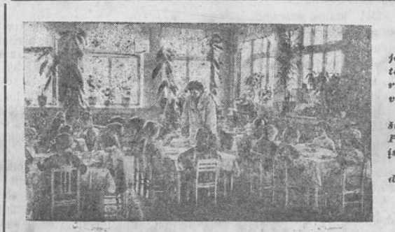
LENINGRADAS. Fibergo rajono vaikų darželis Nr. 21 aptarnauja Mikojano vardo fabrikos darbininkų ir tarnautojų vaikus. Visuomeninės apžiūros metu šis darželis tarp visų TSES Pramones ministerijos vaikų įstaigų užėmė pirmą vietą. Nuotraukoje: pietūs vaikų darželio valgykloje.

Tarybų valdžios metais Rokiškyje pirmą kartą atidaroma vaikų biblioteka taip pat gausiai papildyti naujų knygų ir jaunimo literatūros leidimais.