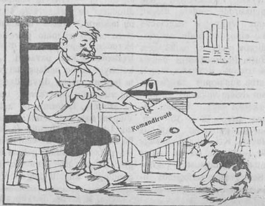
Drg. Gurklis: „Vesti kova su graužikais pavedu tau“.

„Kavolių“ kolūkio (Panemunio vls.) pirmininkas nestrūpina grūdų sandėlio patalpų sutvarkymu. Sandėlyje nešvaru, visur ant grūdų pridarstyta grūdų, nekojojama su išvėsusiais graužikais.