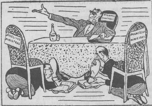
Trijų ministrų pozicijos...