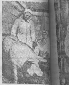
MASKVOS SEITIS. Ueleno ko rajono 12-tųjų spalio lenktynių vardo kolūkis prieš įvykdė visuomeninės gynybos kystės išvystymo planą. Ūkis rajone pirmąją plyninkystės produktų priemonę valstybei.

Kolūkiečiai žymius laimėjimus pasiekė kiaušinių išplėtime: planas įvykdytas 118 proc. Kiaulienkystė ma sėkmingai augina gausias stambius baltųjų mėsos kiaules.