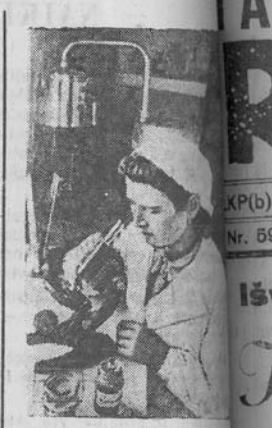
KRASNODARO KRAŠTAS. Visuotinėje randasi 16 dirbtinio gyvulinio punktu. Seniausiam punktui 11 metų jauje drg. A. A. Pils. Prailtas naujas punktas įvykdyti dirbtinio stambiųjų apvalinimo planą 330 proc. o ar proc. Nuotraukoje: dirbtinio apvalinimo kas A. A. Pils kolektiyvino škie, laboratorijoje.