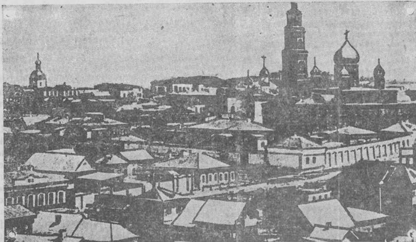
Simbirskas (dabar Uljanovskas), kur gimė V. I. Leninas.

Viskas, ką pasiekė ir padarė jo TSRS darbu žmonės, visa tai yra patvartą su nenugallima Lenino ir Stalinui genialiai vadovavimu. Leninui ir Stalinui skiriamai vienas nuo kito darbo žmonių sąmonėje.