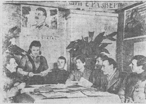
Teisū valstiečius Pasvaigės apylinkės klube-skaitykloje išskūrė rinkiminės apylinkės Nr. 8 agitpunktas. Čia yra daug rinkiminių literatūros, laikraščių ir žurnalių. „Komjaunuolis“ žemės ūkio arteles kolūkiečiai latsvalakij pralėdžia agitpunkte. Agitatoriai rengia pasikalbėjimus su rinkėjais.