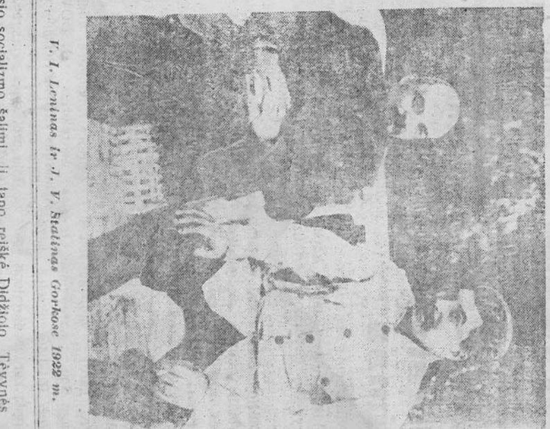
V. I. Leninas ir J. V. Stalinas Gorkose 1922 m.

Per 26 metus, prieš V. I. Lenino Tarybinę