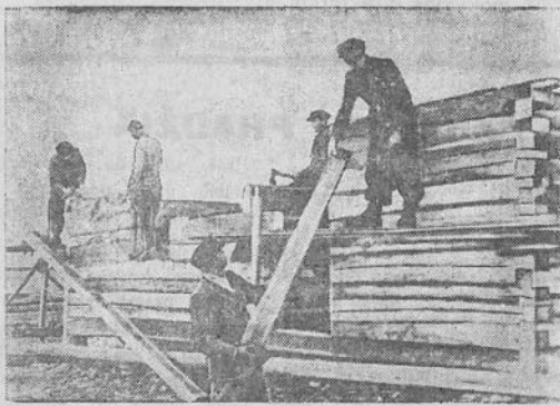
Prie Kaišiadorių apskrities Žiežarių valsčiaus Stalino vardo kolūkio suorganizuoti kolūkių stovyklų brigadų brigadininkų kursai. Kursuose mokosi 15 žmonių iš Žiežarių valsčiaus kolūkių. Praktikos užsiėmimus klausytojai atlieka prie kolūkių stovyklų. Nuotraukoje: paukštidės stovykloje.