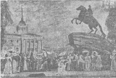
Valstybiname TSRS Didžiajame akademiniame teatre įvyko baletas „Varinio ratelio“ premjera. Baletas sudarytas pagal didžiojo rusų poeto A. S. Puškino poemos motyvus. Nuotraukoj: scena iš pirmojo veiksmo.