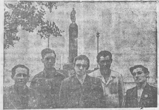
Liepos mėn. 27 d. suina penktosios metinės nuo Šiaulių išvadavimo iš vokiečių grobikų. Šią datą ruošiai plačiai paminėti miesto išvadotojai, grįžusieji prie talkaus kuriamojo darbo. Visi jie eina stachanovines sargybas.

Plenumas svarstėtu klausimu prieme atitinkamą nutarimą. J. Kapčiūnas