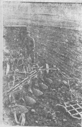
VINICOS SRITIS. Liūsko rajone Lentvo vardo kolektyvinėje mokykloje. Nuotraukos: dirvų paruošimas po žieminių pasėlių.

ST. DAKTARIŪNAS, Apskr. Ž. ū. skyriaus agronomas