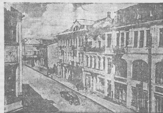
Prieš penkeris metus vokiškieji grobikai, bėgdami nuo Tarybinės Armijos, sugriovė visas pramonės įmones, daugelį visuomeninių ir gyvenamųjų pastatų Šiaulių mieste. Tačiau miestas sparciai atstatė. Šiauliai šien- dien – tai didžiulė statybinė aikštė. Mieste beveik nėra nei vienos gatvės, nei vieno kvartalo be statybinių pastatų. Nuotraukoj: atstatytieji Gegužės Pirmosios gatvė Šiaulių mieste.

Kėkiais tempais auga respublikos pramonė pėkariniais metais, matyti iš tokio fakto, kad pernai pramonės gamyba padidėjo išties treėdaliu, palyginti su 1947 m., o 3 kartus, palyginti su 1945 m. Šiais metais pramonė toliau spartina savo darbą. Š. m. gegužės mėn. produkcijos gamyba respublikoje buvė 37 proc. didesne, negu tą patį mėnesį 1948 m.