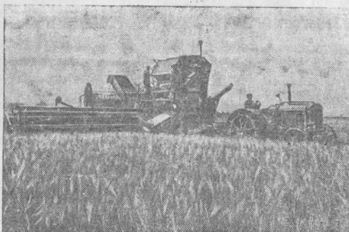
Kubanėje Ust-Labinsko rajono „Raudonojo putloviečio“ kolūkyje vyksta derliaus nuėmimas.

KLIAUGAITĖ GENĖ, Rokiškio valsč. „Vilties“ kolūkio karvių melžėja