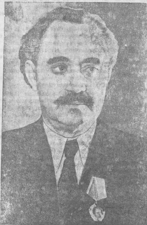
Liepos 2 dieną mirė įžymus tarptautinio darbininkų sąjūdžio veikėjas, Bulgarijos Liaudies Demokratinės Respublikos Ministrų Tarybos Pirmininkas, Bulgarijos Komunistų partijos Centro Komiteto generalinis sekretorius drangas Georgijus Michailovičius Dimitrovas.