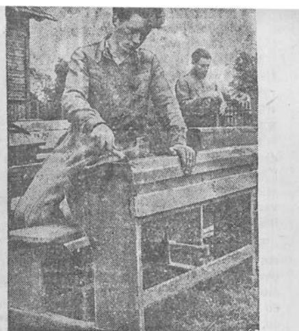
Šiemet Kėdainių apskrities Karolio Požėlos vardo kolūkie baigia statyti savo pradžios mokyklą. Kolūkiečiai naujų mokslo metų pradžiai ruošia visą mokyklinį inventorių: suolus, stalus, spintas, lentas.

Nuotraukoje: kolūkiečiai Dėmintas remontuoja iš valsčiaus mokyklos gautus suolus.