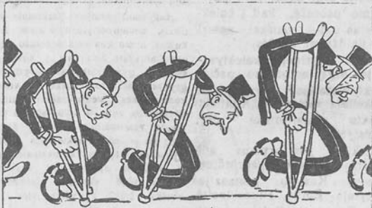
Maršalizuotos ekonomikos paradinis maršas. A. Baženovo pieš.