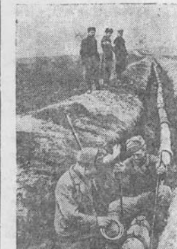
VORONEŽO SRITIS. Srities kolektyviniai ūkiai šiais metais išplėčia dirbtinoms žemės plotą 13.000 ha. Rosošauskio rajone bus paleistos 5 drėkinimo sistemos. Ši sistema apdrėkins 106 ha pasėlių plotą. Apdrėkintame žemės plote „Austros“ kolektyvinis ūkis pirmą kartą pasėis ryžius ir kitas kultūras. Nuotraukoje: montažo brigada darbo metu.