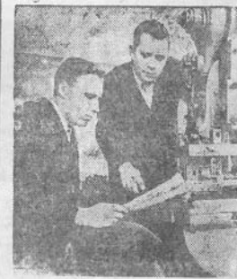
LENINGRADAS. „Svietlance“ fabrike įsteltą eksperimentalinę dirbtuvę racionalizatoriais ir išradėjais. Čia gamybos novatoriai gali pagaminti įvairius pritaikymus ir prarasti jų bandymus. Į pagalbą racionalizatoriams išskirta inžinierių grupė.

Grūdų sandėlio statyba baigta. Artimiausiu laiku atiduodama eksploatacijon viena karviėdė.