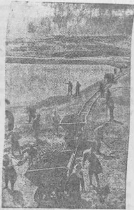
KIROVOGRADO SRITIS. Novoproskio rajone plačiai išplėtę pradų ir traukinių statyba. Didelę užtvanką stato „Červonij prapor“ ir antrojo penkmečio vardo kolektyvistai ūkiai. Ši užtvanka leis pastatyti pradą su 17 ha vandens paviršiumi. Nuotraukoje: užtvankos statybos bendras vaizdas.