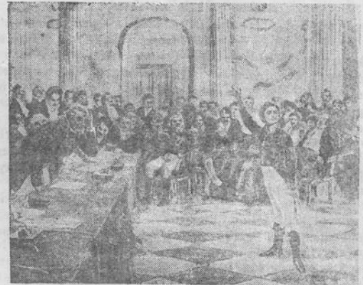
Keliuamuosiose egzaminuosio liūbioje A. Puškinas skaito savo eilėraščių „Praliminimas apie Carskoje Sielo“ dalyvaujant poetui Doržaviniui. I. Repino paveikslas fragmentas