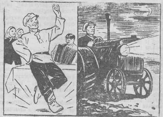
Geras šokas Su ugnelel