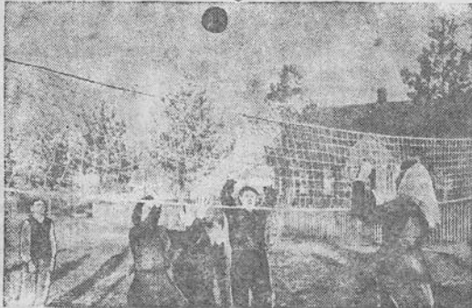
Šiaulių valsčiaus „Pirmyn“ žemės ūkio artelėje sportas tampa būtis dalyku. Kolektyviniame ūkyje sudarytos futbolininkų, tinklinio komandos ir šachmatininkų ratelis. Dabar kolektyvinio ūkio sportininkai ruošiasi vasaros sporto varžyboms.

Nuotraukoje: tinklinio komanda treniruotės metu.