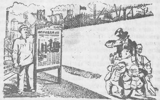
„Tiesa“ („Pravda“) akis įbado. A. Morozovo piešinys TASS'o spaudos kišė.

LINGYTE, „Nėmuno“ f-ko sienlaikraščio „Spartuolis“ redaktorius