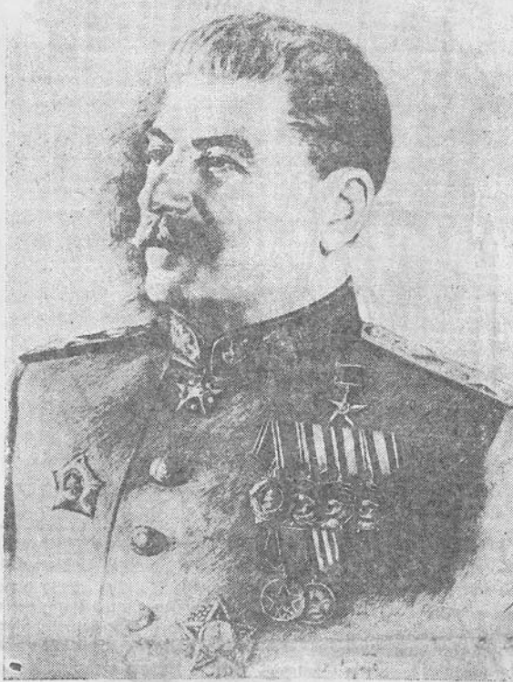
Šlovė didžiajam Stalinui!

Su Lenino vėliava, Stalinui vadovaujant, pirmyn, į komunizmą pergalę!