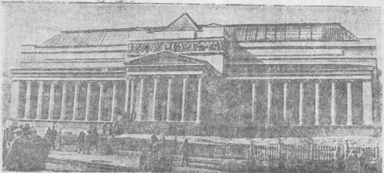
MASKVA. A. S. Puškino vardo dalies meno muziejus.