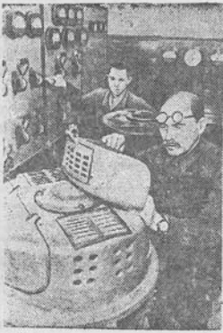
Moskvos elektromechaninis fabrikas „Glavselektro“ išleidžia kaimų elektrifikavimui generatorius 50 kilovoltų pajėgumo. Praeitais metais fabrikas išdirbo ketiolika dešimčių generatorių visų pango. Etnamaisiais metais generatorių išleidimas padidės dvigubai.