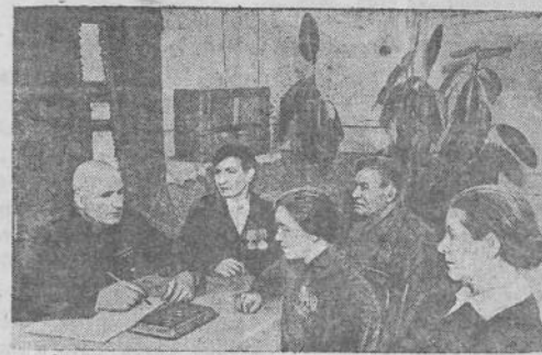
MASKVOS SŪTIS. Kalnino vardo kolektyviniis ūkis užbaigė visus pagrindinius priešpavasalius darbus. Atremontuotas inventoriaus, paruoštos veislinės sėklos. Kolektyvintinkai praveda didelį darbą dėl sėjamojo ploto išplėtimo.