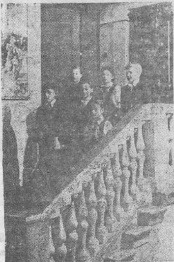
VILNIAUS PIONIERIŲ RŪMAI

Pečiai prisilęgti jau gilios senatvės, Plaukuos — sidabras ir raukšlėtas veidas. Kasryt matau jį einantį per gatvę, Kai devynių nusklinda dužių aidas.