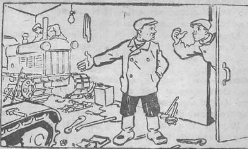
— Pavasaris ateina! — Terul palaukia, aš dar užimtas traktorių remonu...