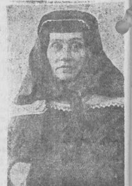
Ekaterina Georgijevna Džugašvili - J. V. Stalino motina.

Lenino — Stalino teorija apie galimumą sukurti socializmą vienoje šalyje pilnutinai triumfovo. Technikinė revoliucija pramonėje, transporte, žemės ūkyje,