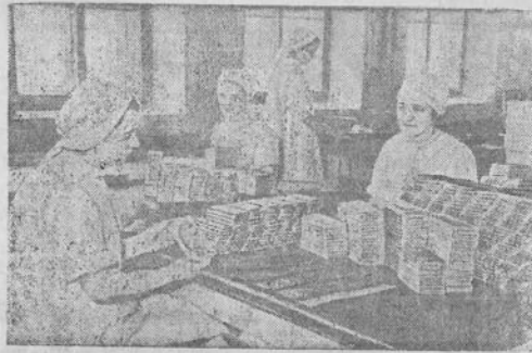
Maskvos „Rot-Front“ konditerijos fabrike 51 brigada užtarnavo garbingą pulkios kokybės brigados vardą. Per 10 mėnesių fabrikas išleido apie dešimt tonų konditerinių gaminių viršum plano. Nuotraukoje: saldainių ceche. S. Stichino nuotrauka TASS'o spaudoje kiti

Paskutiniu laiku „Plūgo“ fabrikas gavo elektrinį suvirinimo aparatą, kuris bus naudojamas naujųjų plūgų PP-28 gamybai ir kitiems darbams. Šis elektrinis agregatas yra tuo patogus, kad elektros srovė pakeičia suvirinimui reikalingas medžiagas — deguonį ir karbitą. Juo naudotis bus apmokyti keletas darbininkų. J. Lauraitis