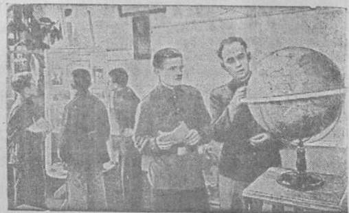
TOTORIU ATSR. Žaltavintu amatu mokykla Nr. 2 ruošia šaltkalvius, tekintojus, lietuks ir modelistus.

II-ju klausimu pranešimą pa- J. Ževellauškas