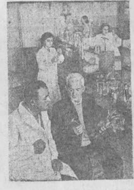
BAKU. Agrochemijos ir žemdirbystės tyrimo institutas prie Azerbaidžano TSR Mokslų Akademijos užimtas naujų tyrimų gamtoje būdų iš naujos lėkanų, skirčių kolūkių laukams, tyrinėjimai.

Ateityje partijos Ragielių valsčiaus komitetas, komunistams teikdamas partines užduotis, tuo pačiu žymiai sustiprins ir jų vykdymo kontrolę. Sažiningas partinių užduočių vykdymas ir nuolatinių kontrolė užtikrins spartesnį valsčiaus darbo valstiečių žengimą kolektyvinių ūkių santvarkos keliu į socializmo sukūrimą kaime.