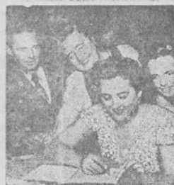
VENGRIJA. Su dideliu pakilimu visoje šalyje pradėjo Vengrijus penkmetinio plano Valtūnais paskolos pasirašymas. Vengrijos Liaudies respublikos dirbantieji pasirašė paskolą 702.227.000 forintų sumoje, iš viršijo 50,5 proc. numatyti pasirašymo suma. Nuotraukoje: vieno fabriko darbininkų grupė pasirašo paskolą.

Iš gerai ir tinkamai paruoštų linų bei lino šiaudelių gaminama visada jų aukštesnė rūšis. Už aukštesnę rūšį koliai ir pavieniai valstiečių akiai gauna atitinkamai aukštesnį apmokėjimą, apibrėžtinių pramoninėms prekėms, daugiau užskaitoma grūdų bei bulvių valstybinių prievolių sąskaiton. Iš gerai paruoštų linų bei lino šiaudelių lino apdirbimo fabrikai daugiau duoda aukštos kokybės gaminių, mašina gaminių savikaina, ilgas lino pluoštas (bruktas) yra perpus brangiau vertinamas, kaip trumpas pluoštas (pakulios).