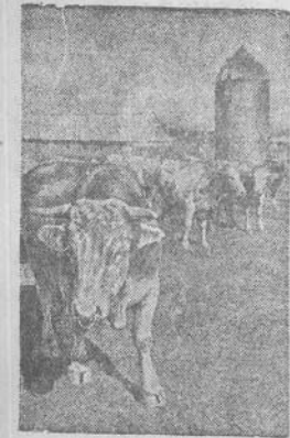
SARATOVO SRITIS. Voronovo rajone priešakinis „Revolucijos signalo“ kolūkis sėkmingai vykdė visuomenės gyvulininkystės išvystymo planą.