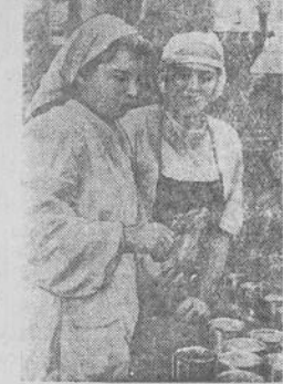
KAMČATKOS SRITIS, Ust-Bolšerecko rajono Mikojaus vardo kombinato žuvų konservų fabrikas jau įvykdė konservų išleidimo metinį planą.