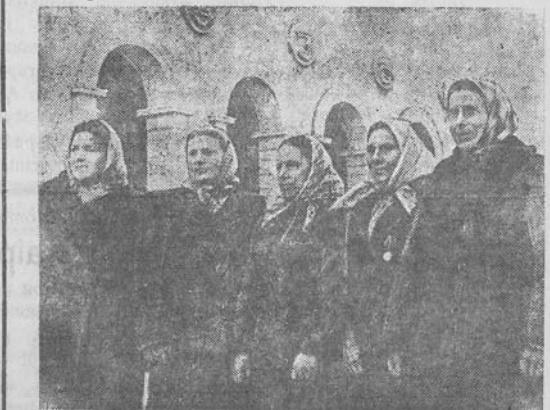
Vilniuje prasidėjo respublikos gyvulių augintojų pasitarimas, į kurį suvažiavo geriausiai kolektyvinių ir tarybinių ūkių gyvulininkai.

Inventorių ir mašinas remontuoti pradėjo taip pat „Kominizmo kelio“, „Aukštinės varpos“, „Pergalės“ ir kitos žemės ūkio artelės.