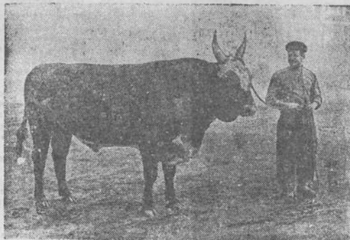
ASTRACHANĖS SRITIS. Stepnovsko rajono Volodarskio vardo kolektyvinis ūkis nėvėsi kalmukų veislės stambiusius raguotus.

rainių. Už jį pinigų įnešė mokytojas. Sekančią savaitę mokytojai padaryti teko ne tik už vieną berniuką; dabar jau trys nužengė nuo teisingo kelio, nors ir atsprasė. Mokytojas ėmė vartoti gestus ir riksmą, maldaivo šventojo atvaizdą, prikalta prie sienos; bet tai jau nevirkdė berniukų. Viskas tapo įprasta. Buvo ir tokių berniukų, kurie — nors jie nerodė to, — matydami, kaip mokytojas iškeltais kumščiais ir krauju parusuviu veidu pomirtiniu balsu pranašauja nelaimės, savyje juokėsi iš jo. Dievo rūstybė — akmuo, šlifuojantis tikėjimą, duodantis jam blizgėjimą; bet jeigu juo piktnaudžiaujama, jis tikėjimą bukina. Vaikai jau nesibijojo kaip anksčiau. Tačiau savo dešimt