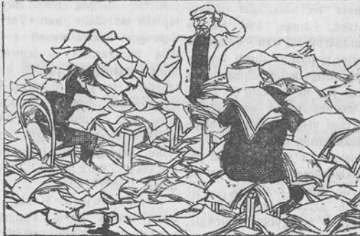
Valstietis (apskritis Žemės ūkio skyriuje):

Apskritis Žemės ūkio skyriaus agronomas ir zootechnikas vis dar tęsia savo kabinetinį, kancelarinį vadovavimą apskrities kolūkiams, užsibarikadavę statistiniais duomenimis, įvairiomis atkreipimomis, pranešimais - nepastebi tikros padėties kolūkiuose.