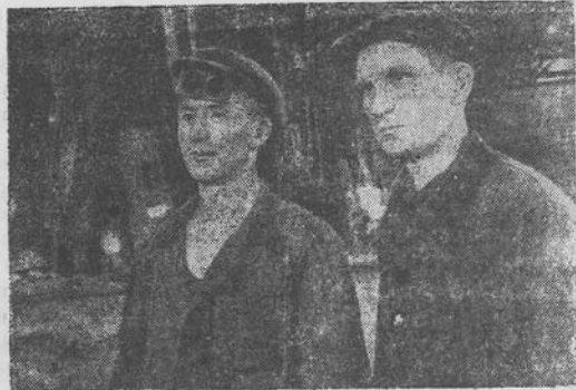
Maskvos metalurginio fabriko „Piautavas ir kuzin“ Martenovsko cechui Nr. 1 už gerą darbą pirmame ir antrame ketvirtyje suteiktas vardas „Geriausias Tarybų Sąjungos plieno liejimo cechus“

Valstijų partinės ir tarybinės organizacijos privalo padėti j savo kasdieninio darbo pagrindą kolūkių valdyboms paramos suteikimą, kolūkių organizacijai — ūkinį stiprinimą, pakelti pačių kolūkiečių aktyvumą dėl sėkmingo trimečio plano visuomeninei kolūkių gyvulininkystei išvystyti įvykdymo.