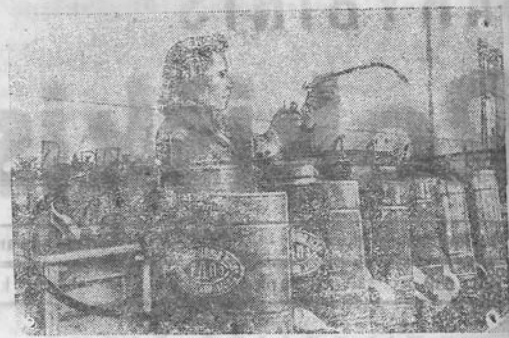
„Lvov—Selma“ (UTSR) [Lvovo] fabrikas masiniai šleidžia nešiojamas purkštuvus „RDPZ“, kurie yra naudojami nuodų išpurkštėjimui naikinant žemės ūkio kenkejas.

Draugas Stalinas parodė t pašu, kad Tarybų Sąjungai negalima įsauginti šantažu tokį samdinį visai išnaudoti, o partinė bei komjaunimo organizacijos neįsąntažina samdi-