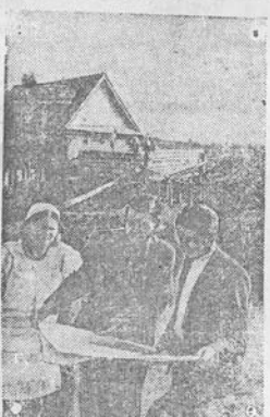
Totorių TSR, „Arsko rajono“ žemės ūkio artelės „Udarnik“ kolektyvininkai savo įėjomis stato prie Kazankės upės hidroelektri- nė stotį 15 kilovattų pajėgumo. Elektros stotis aptarnaus 275 gyvenamus pastatus, o, taip pat, ketelį kolektyvinio ūkio įėjainių.

Sudarymas tamprus ryšio su moterų masėmis, išrenkant iš jų aktyvą, drg. Geidonienė padės pasiekti tikrai gerų rezultatų. (Mūsų koresp.).