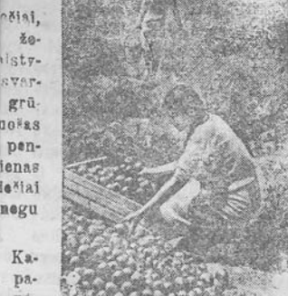
Netoli nuo Baku esantis „Zelionije Maštagi“ kolektyvinis ūkis yra stambiausias Apskerone. Jis aprūpina daržovėmis Baku natūrininkus.

Per darbo dienos laiką sutrumpinama 30 min. pertrauka pusryčiams, neįskaitant įstatygo patalpų.