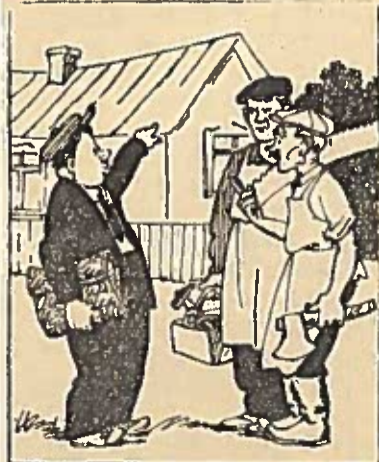
Kolūkio pirmininkas stаты- bininkams: —Aš jums parodysiu visuome- ninį darbą! Marš prie mano namo!

Teismų rinkimai paplido liaudies tarėjų eiles gamy- bos pirmūnais, priešaki- niais Lietuvos žemdirbiais, tarybinės inteligentijos at- stovais. Išleidžiama litera- tūra apie socialistinį teisė- tumą prisidės prie jų gar- bingų ir atsakingų pareigų vykdymo.