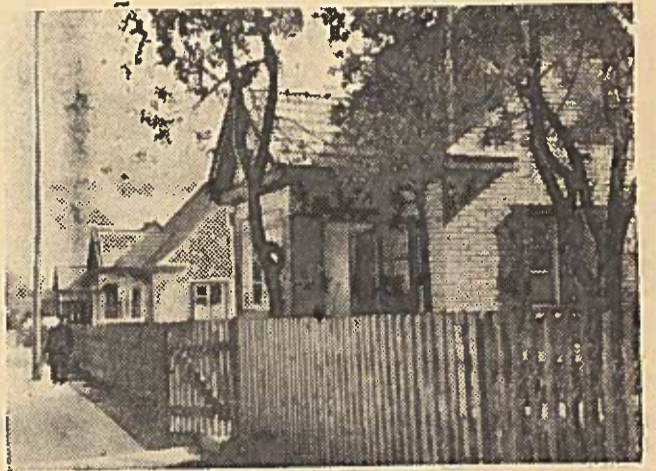
Priekulėje neseniai atiduotas eksploatuoti dviejų aukš- tų šešių butų komunalinis gyvenamasis namas. Iki metų pabaigos bus baigti dar keturi gyvenamieji namai. Pra- dėtos statyti sporto salė ir kepykla. Nutiesta nauja Vingio gatvė, kurios abiejose pusėse statomi nauji namai.

Už aktyvų darbą prof- esjungose, už nuopelnus organizuojant darbo žmonių mases vykdyti socialistinės statybos uždavinių ir sukakus penkiasdešimtosioms profesinių sąjungų me- tinėms TSRS Aukš- čiausiosios Tarybos Pre- zidiumas apdovanojo