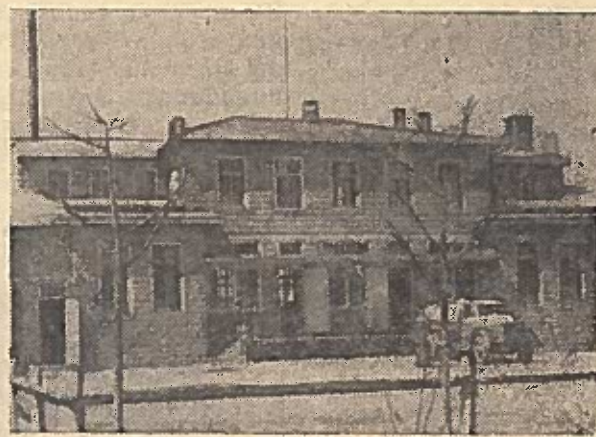
Salų sviesto gamybos įmonė

Antarktikoje pagal tarptautinių geofizikos metų programą. Ji toliau vykdys meteorologinius, aerologinius, gliaciologinius, jonosferos, geomagnetinius ir geografinius stebėjimus Mirno observatorijoje ir slotyje Vos- tok. (TASS—ELTA).