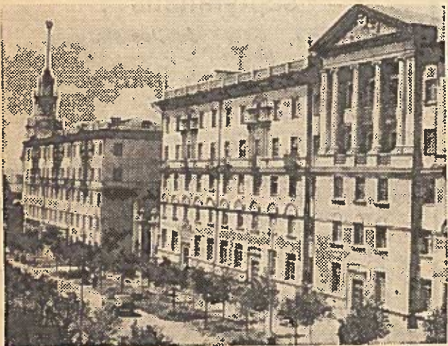
MINSKAS. Nauji gyvenamieji namai Raudonojoje gatvėje.

Ateinančiais metais numatome pagaminti kiekvienam 100 ha arimo po 47 cnt kiaušienos, o dar po metų nemažiau 50 cnt.