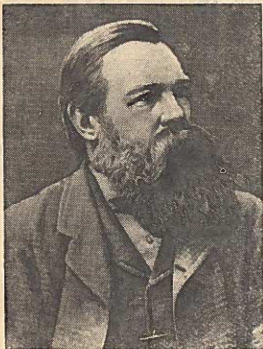
Lapkričio 28 dieną sukako 138 metai nuo didžiojo mąstytojo ir mokslininko Fridricho Engelso gimimo dienos. (1820. XI. 28—1895. VIII. 5).