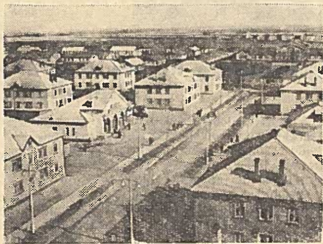
KUSTANAJAUS SRITIS. Statomas Sokdovo-Sarbaisko rūdos perdirbimo kombinatas artimiausiais metais taps pagrindiniu geležies rūdos tiekėju Pietų Uralo metalurgijos gamykloms. Kartu su pramonės įmonių statyba sparčiais tempais auga Rudnyj miestas. Jau pastatyta virš 120 tūkstančių kvadratinį metrų gyvenamojo plotu. Statomas dvi mokyklos, ligoninė, plačiaekraninis kino teatras, duonos kepėkla, šiluminė elektros centralė ir eilė kitų objektų.

Paruoštas spaudai taip pat dainų šventės šokių repertuaras.