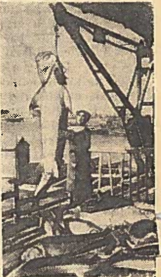
Nuotraukoje: žuvis iškrovimas iš kombinato keltos.

ASTRACHANĖS SRITIS. Didelių darbo laimėjimų pasiekė Astrachanės liaudies ūkio tarybos mėsos pramonės valdybos Oranžerinio kombinato kolektyvas. Metinį planą jis įvykdė iki rugpjūčio 10 dienos. TSKP XXI suvažiavimo garbei kombinato kolektyvas prisėmė naujus socialistinius įsipareigojimus. Jis nutarė paruošti virš metinio plano 89 tūkstančius centnerių žuvis.