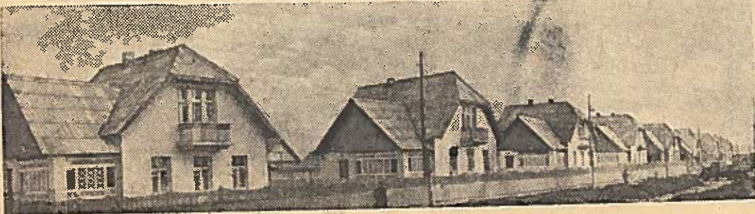
Dešimtys gyvenamųjų namų pastatyta šiemet Nėdovės mieste (Kaliningo sritis) šachalininkams. Nuotraukoje: nauji keturių kambarių namai

Vidutinės dienos racionas karvei tvartinu laikotarpiu susideda iš 6 kilogramų šieno, 20 kilo-