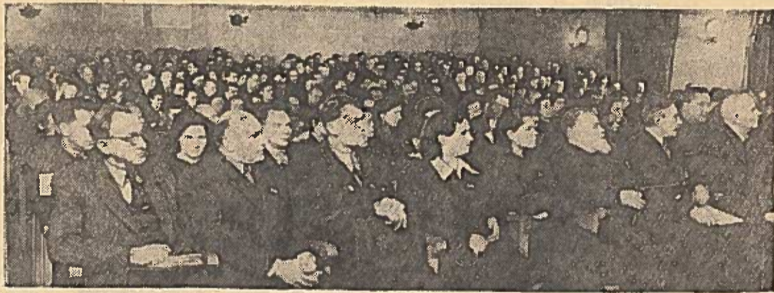
★ Lietuvos TSR Aukščiausiosios Tarybos septintosios sesijos posėdžių salėje. ★

Aukščiausiosios Tarybos Pirmininko pavaduotoja deputatė J. Narkevičiūtė pranešė, kad visi sesijos darbų tvarkos klausimai išsemti, ir paskeibė sesiją uždaryta. (ELTA).