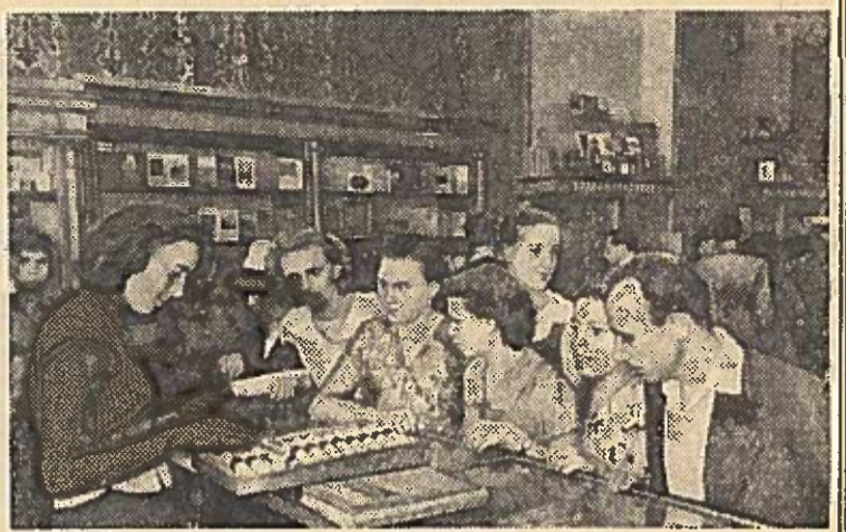
Informacijos biure galima gauti žinių apie knygas, paruoštas pardavimui, išėjusias iš spaudos ir ruošiamas spaudai. Be to, čia vyksta pasirašymas ir išdavimas prenumeruotų leidinių. Nuotraukoje: naujame knygynė.

MASKVA. Kirovo gatvėje atidarytas stambiausias knygynas. Jo prekybos statulų ilgumas siekia 2 kilometrus ilgio. Čia priskaitoma daugiau kaip 30.000 knygų pavadinimų. Knygynas yra užsienio kalbų literatūros, knygų paštu ir dovanų skyriai.