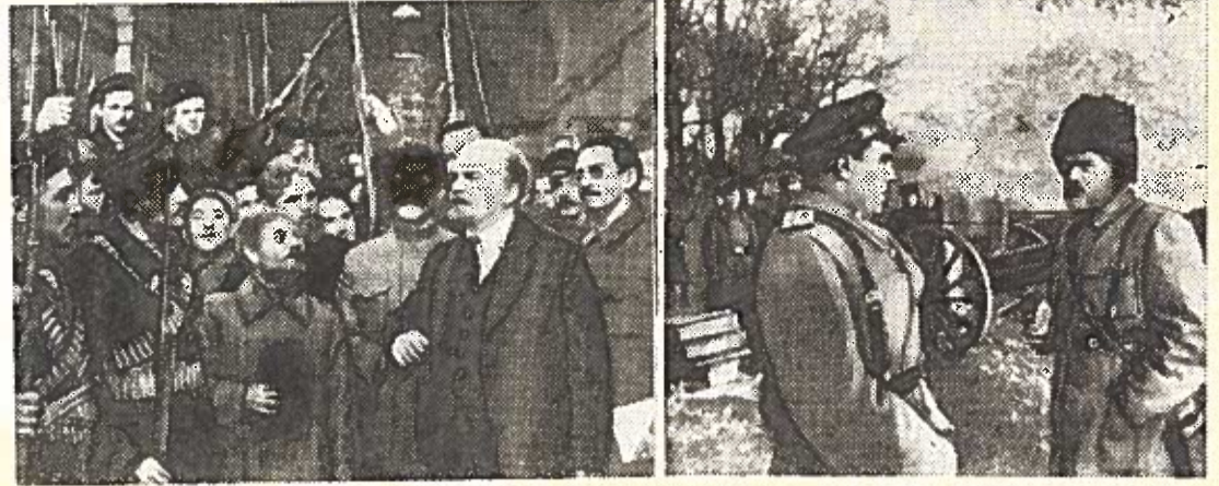
Ekranuose demonstruojamas meninis istorinis—revoliucinis kino filmas „Tiesa“. Scenarijus sukurtas A. Korneičiuko pjesės motyvais.

Jau ne pirmus metus tęsiasi pirmasis pasaulinis karas, sukeltas imperialistų. Didelio revoliucinio darbo fronte, išvystyto bolševikų deka, vis daugiau ir daugiau kareivių pradėjo suprasti, kad Kerenskis apgaudinėja liaudį, kad karas vyksta tik nedidelės kapitalistų ir dvarininkų grupelės interesais. Kareiviai metė šautuvus ir išsiskirstė į namus. Įsmeigė durtuvą į žemę ir kareivis—frontininkas Tarasas Golota.