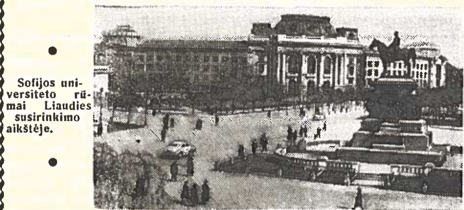
Sofijos universiteto rūmai Liaudies susirinkimo aikštėje.