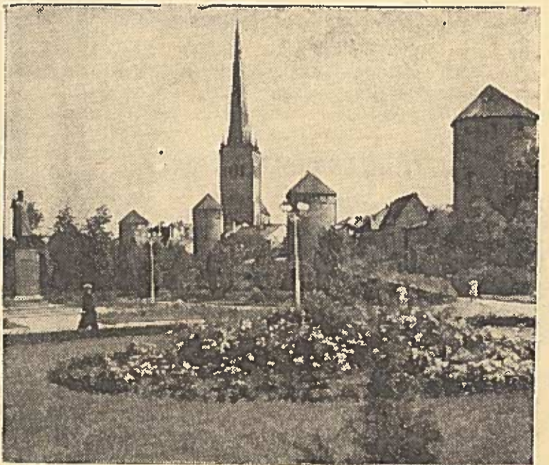
★ TALINAS. Stalingrado aikštė. Kairėje — paminklas M. I. Kalininui.