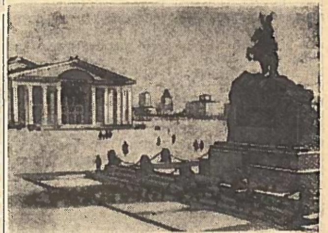
Suche-Batoro vardo aikštė Ulan-Batore.

Seneliai dar atmena ikirevoliucinę, engiamą Mongoliją su jos nešvaria iki pasibiaurėjimo, elgetų pilna sostine Urga. Mongolijos liaudis mirdavo nuo bado ir ligų. Šalyje nebuvo nei mokyklų, nei teatrų, nei ligoninių, nieko išskyrus gūdžius vienuolynus, kur lamos jaunuoliai kalė „šventuo-