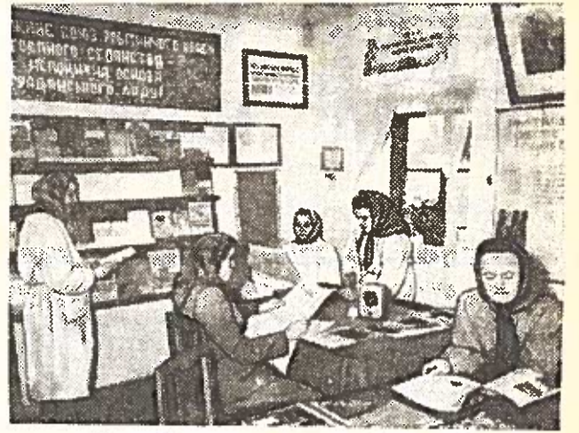
TERNOPOLIO SRITIS. Prie Kazovskio rajono Vorosilovo vardo kolūkio gyvulininkystės termos rengtas raudonasis kampelis. Gyvulininkystės darbuotojai čia praleidžia laisvalaikį, skaito laikraščius ir žurnalus, klausosi radijo.

10. Spalio mėnesyje praveisti iškilmingą komjaunimo keturiasdešimtųjų metinių minėjimą, raportuojant apie prisiimtų socialistinių įsipareigojimų įvykdymą.