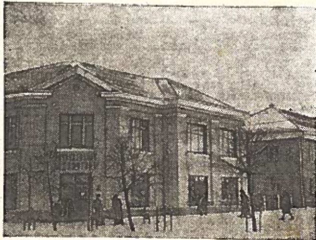
Nauja universalinė parduotuvė Kelmėje.

Šiais metais Lietuvos kino studija įgarsins lietuvių kalba daugiau kaip 30 naujų Maskvos, Leningrado, Kijevo ir kitų šalies kino studijų gamybos meninių filmų. (ELTA).