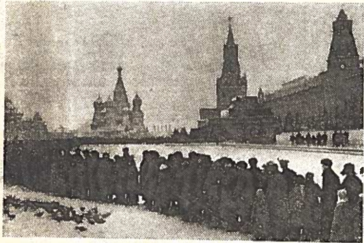
MASKVA. RAUDONJOJI AIKŠTĖ. Dirbantieji aplanko V. I. Lenino ir J. V. Stalino Mauzoliejų.