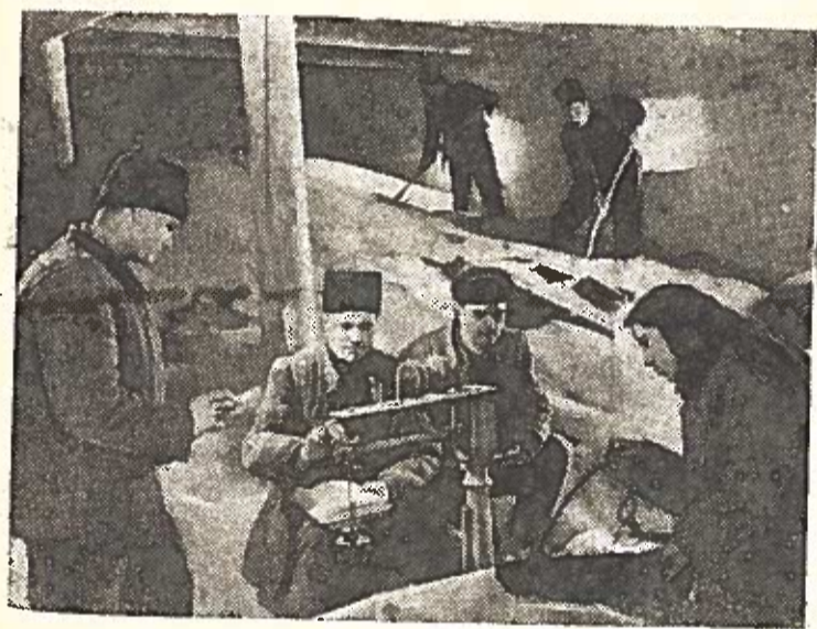
MOLDAVIJOS TSR. Įtemptai ruošiasi pavasariui Belckovo rajono „Naujo gyvenimo“ kolūkio artelės kolūkiečiai. Kolūkio grūdų sandėliuose vyksta sėklių valymas. Į laukus išvezamos trąšos. Plečiamas šiltadaržių ūkis.